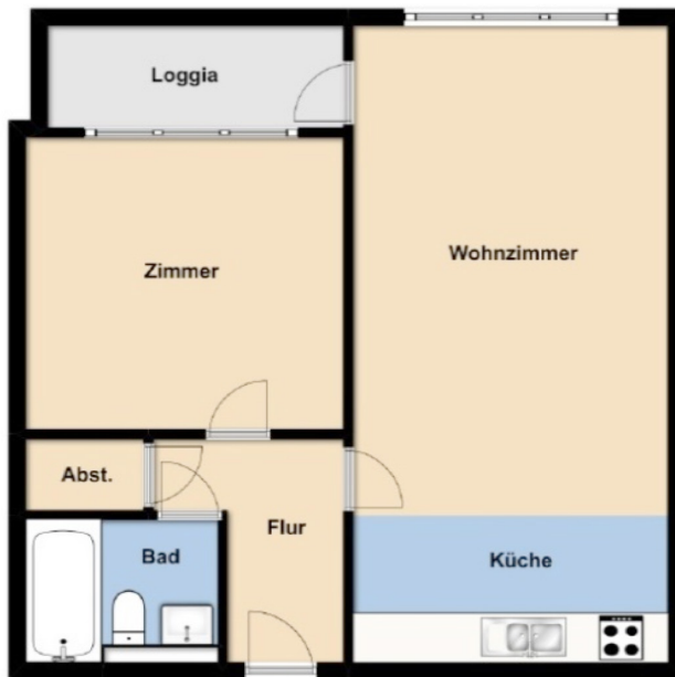
图 1 韦因加尔滕典型的 2 卧室住宅的户型图

那么，这个小区的住宅是什么样的呢？下面介绍本人曾居住过的位于小区西端的标准楼型的内部。这栋建筑竣工于 1968 年，共有 8 层，分成 176 个家庭用分售套房。我自 1997 年起在其中一个典型的家庭用“2 房 1 厨 1 卫”户型中租住了一年时间。（图 1）